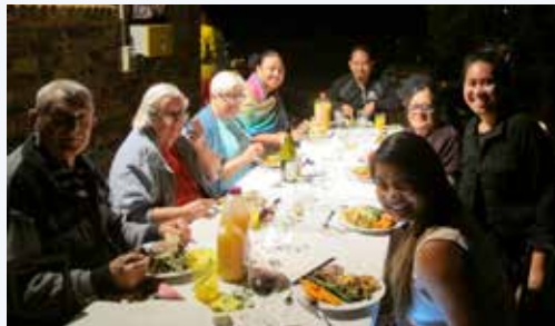
Los miembros australianos disfrutaban celebrando la Noche de guardar juntos