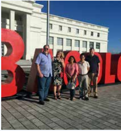
Los Taylor con los Julag-ay en Bacolod