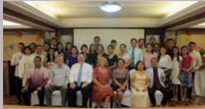
La congregación de Manila