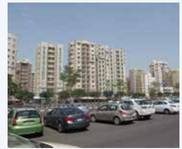
Ciudad de Kuwait

Después de visitar el lugar de la batalla, fuimos a la antigua fábrica de motores Ford, el lugar que se rindió a los japoneses. Después de la