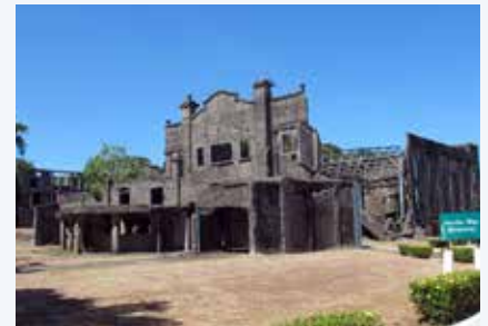
Una de las ruinas de la Segunda Guerra Mundial en Corregidor