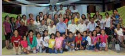
La congregación de Butuan