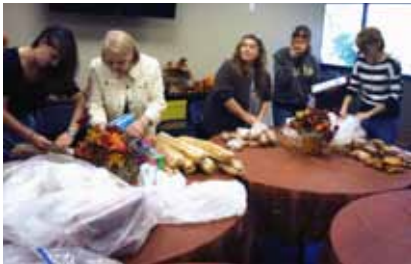
Oct. 31 Distribución de donación de panes