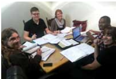
Nov. 14 Estudiando para un examen