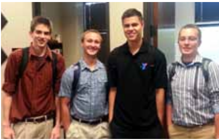
Ag. 19 Primer día de clases