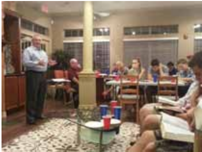
Oct. 11 Primer estudio bíblico la noche de viernes