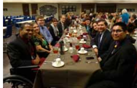
Oct. 26 60 aniversario de Big Sandy