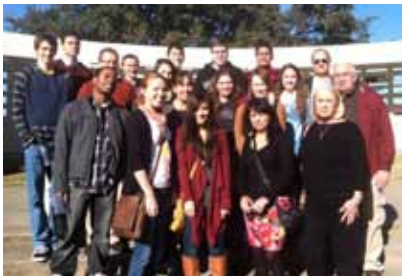
Dec. 18 Parada en Dealey Plaza de camino para el monumento a John F. Kennedy