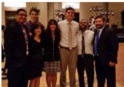
April 19 Actividad de fiestas en Fort Worth