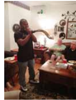
Sep. 6 Práctica de Shofar