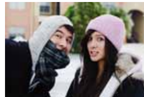
Dec. 7 Estudiantes conectados a los servicios