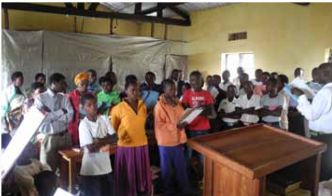
Los hermanos cantan himnos en Giti, Ruanda "Id por tanto," página 10

Se gradúa la segunda promoción del Instituto de la Fundación 4