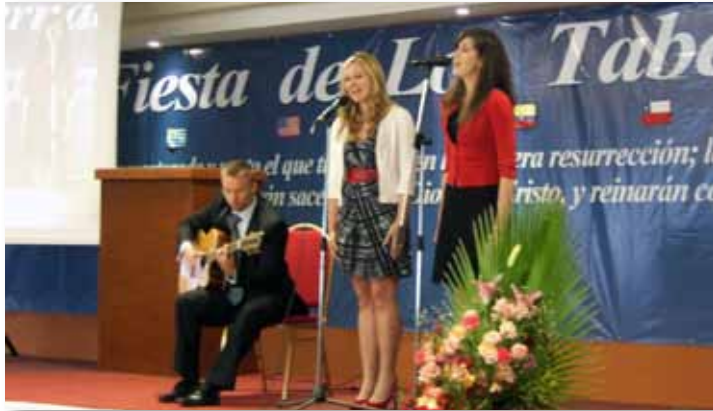
Música especial en Mendoza, Argentina "Prepárese para la Fiesta", página 8