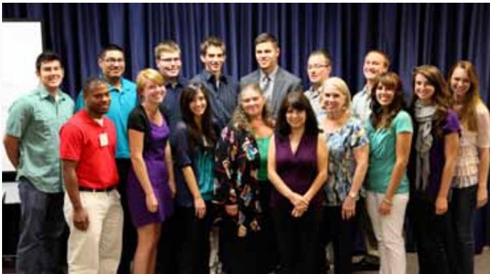
Miembros de la segunda promoción del Instituto de la Fundación comienzan su primera semana de clases "Comienza un nuevo año en el Instituto de la Fundación", página 4.