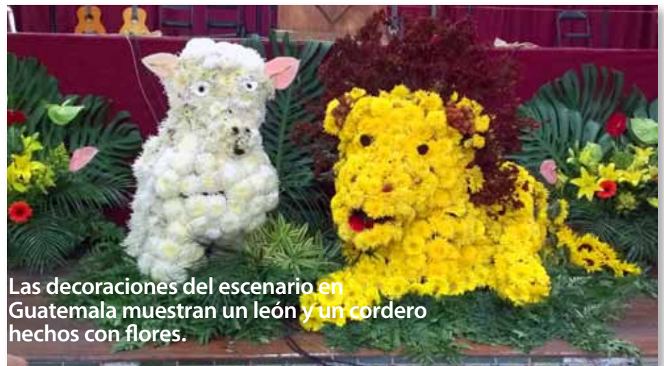
Las decoraciones del escenario en Guatemala muestran un león y un cordero hechos con flores.