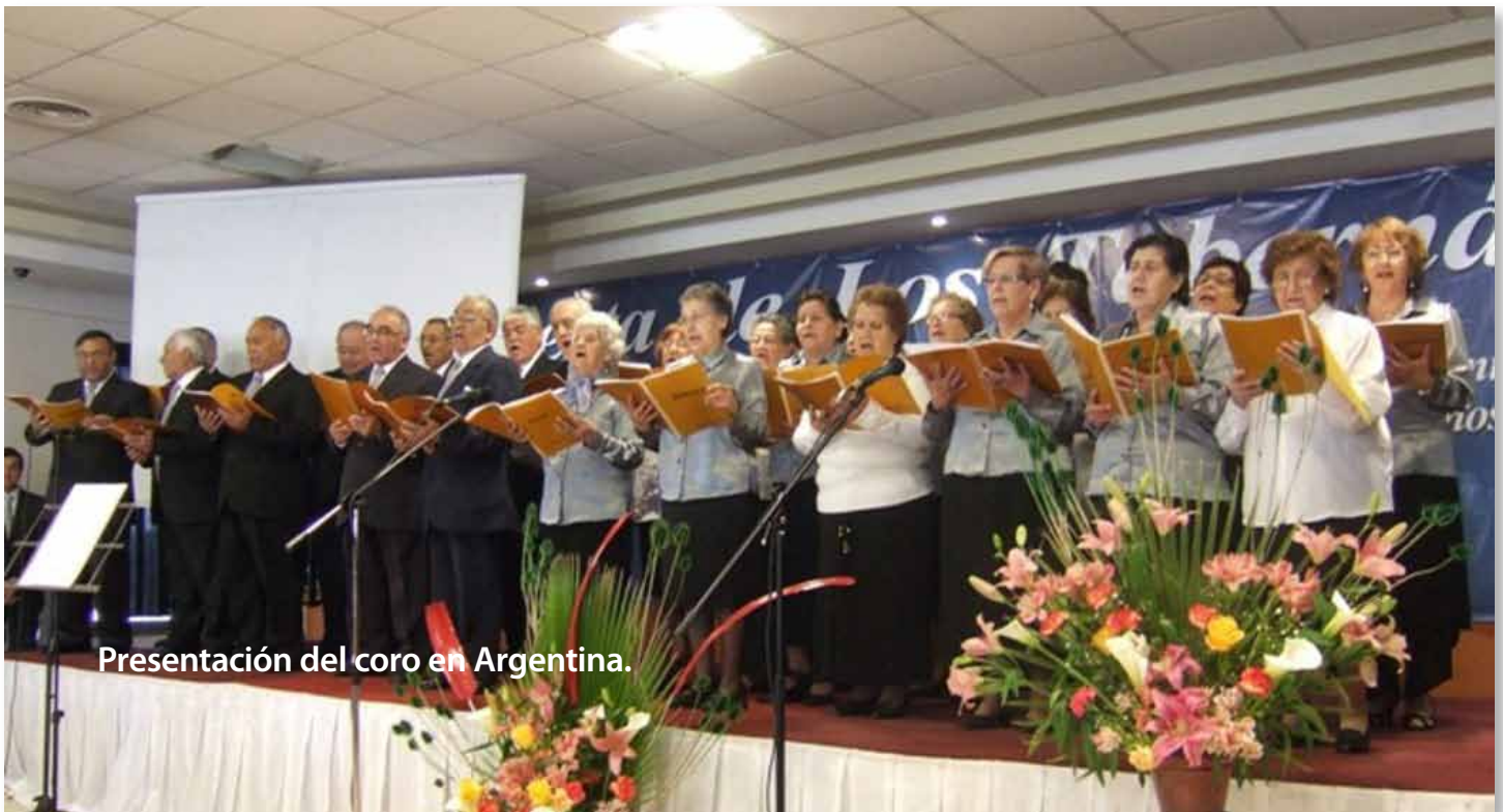
Presentación del coro en Argentina.