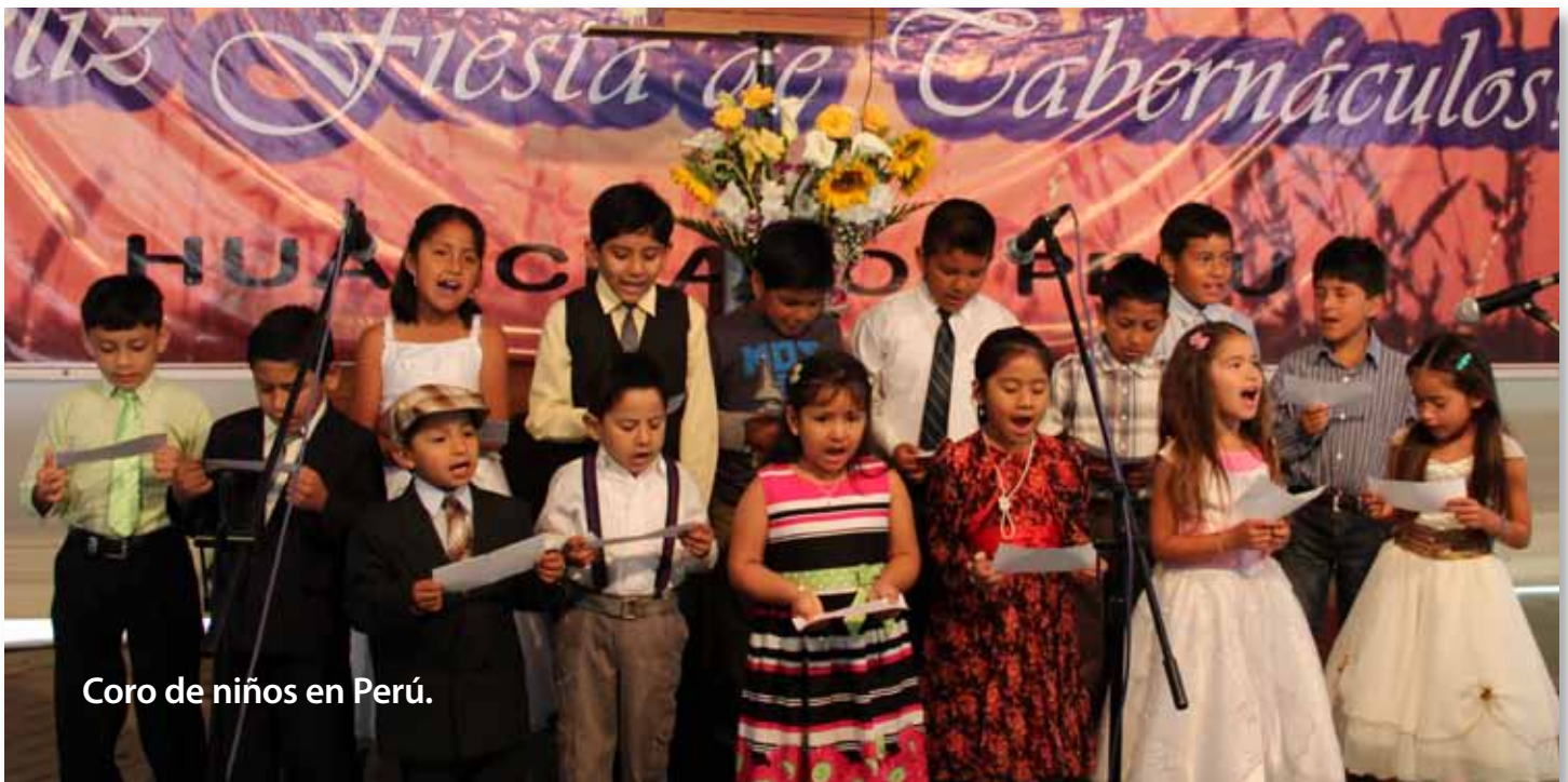
Coro de niños en Perú.

Se desarrollaron actividades para personas de todas las edades, una noche