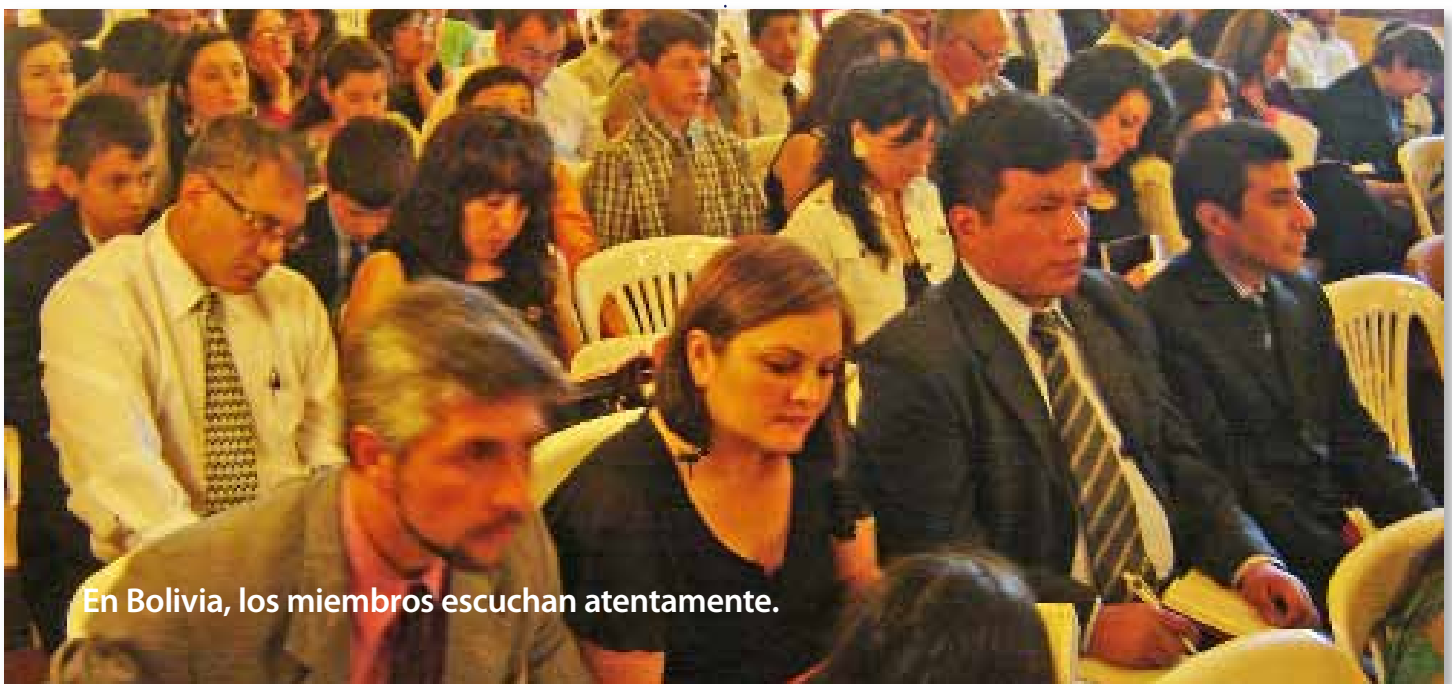
En Bolivia, los miembros escuchan atentamente.

el sermón principal en preparación para la Fiesta de los Tabernáculos.