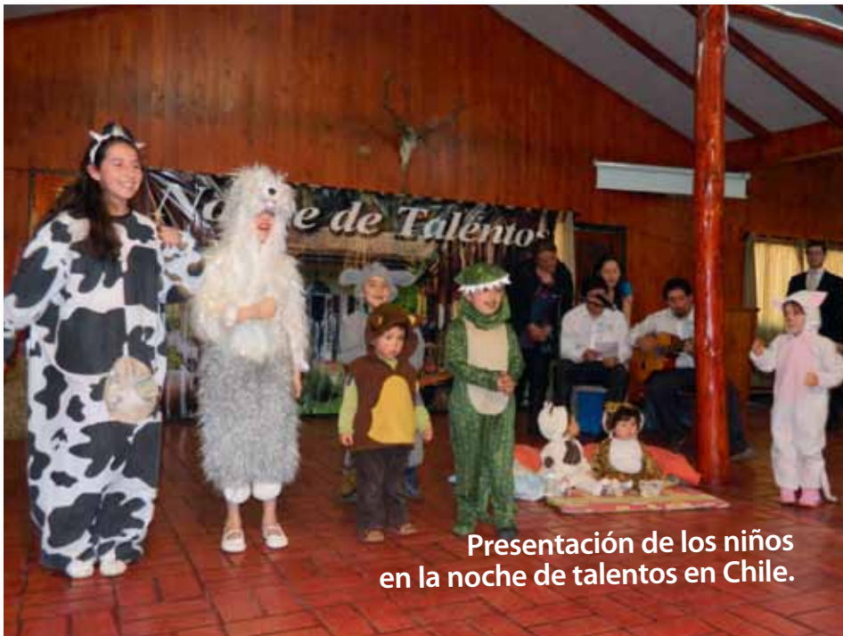
Presentación de los niños en la noche de talentos en Chile.