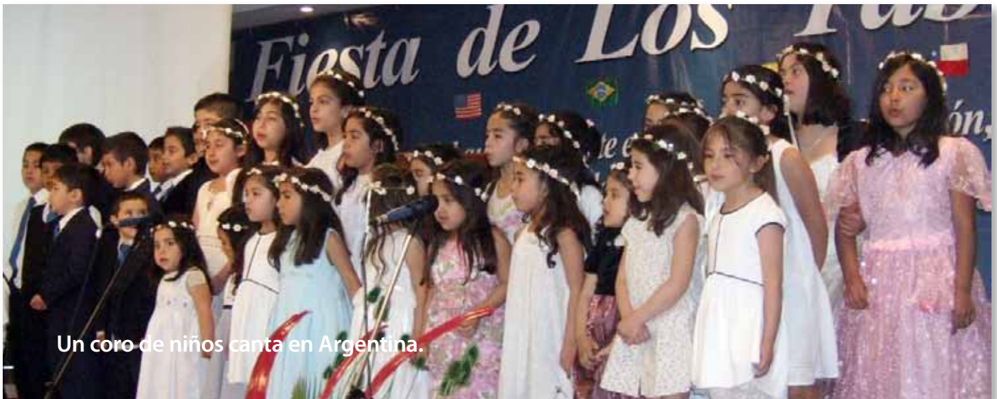
Un coro de niños canta en Argentina.