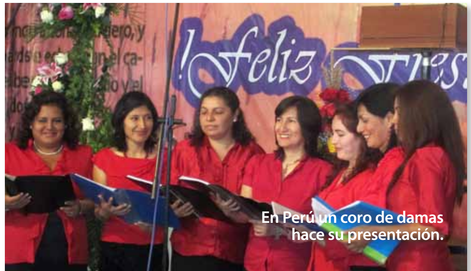
En Perú un coro de damas hace su presentación.

La sede de los eventos fue el Hostal Bra-camonte, que cada año nos adecuía un amplio auditorio que sirve para el desarrollo de múltiples actividades. Cuenta además con dormitorios, comedores,