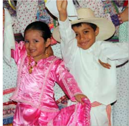
Dos jóvenes bailando en la noche de talentos en Perú.