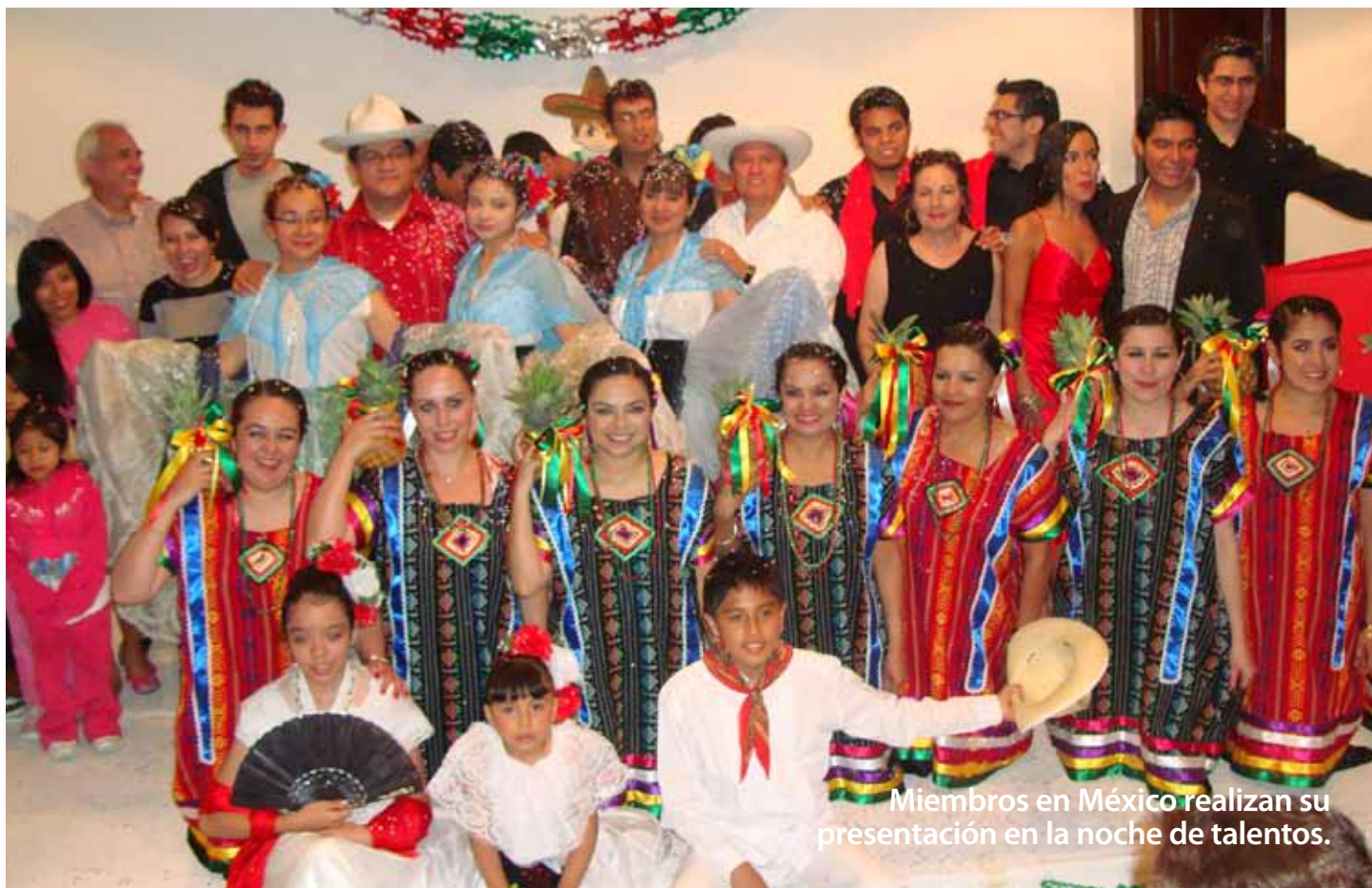
Miembros en México realizan su presentación en la noche de talentos.

La Fiesta de Tabernáculos y el Último Gran Día fueron un tiempo maravilloso con abundante alimento espiritual: estudios bíblicos, sermoncillos, sermones