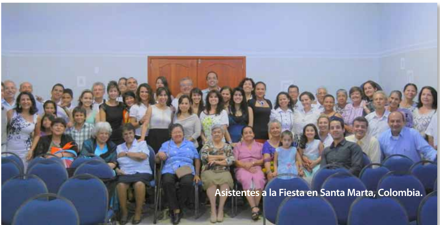
Asistentes a la Fiesta en Santa Marta, Colombia.

COLOMBIA / Sesenta personas procedentes de Colombia, Ecuador y Venezuela, nos reunimos para celebrar la Fiesta de Tabernáculos de 2012. Nuevamente, celebramos la Fiesta en el Rodadero, en el salón de reuniones del Hotel San Francisco.