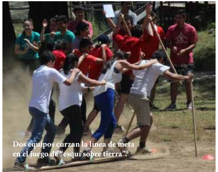
Dos equipos cruzan la línea de meta en el juego de “esquí sobre tierra”.

Ya al final del campamento cada equipo, cuatro en total, presentó obras de teatro las cuales fueron inspiradas en las vidas de Josué, Ester, Elías y Daniel, y todas estuvieron a la altura, con los materiales disponibles en el momento y contando con toda la creatividad de 20 jóvenes por equipo, de entre 12 y 22 años. Cada equipo hizo una animada, inspiradora y muy simpática actuación de los libros asignados. Sin lugar a dudas esta actividad nos mostró la gran capacidad organizativa que nuestros campistas tienen para, en pocas horas, montar estas inspiradoras representaciones teatrales.