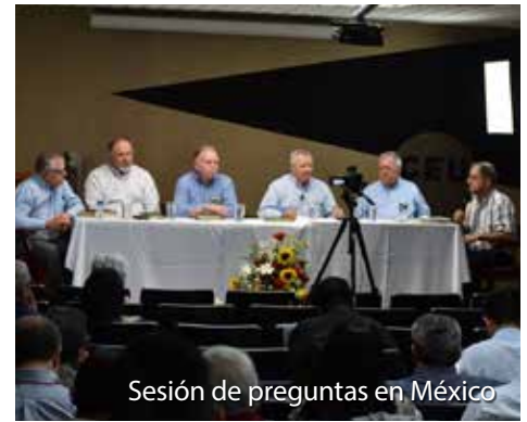
Sesión de preguntas en México

con alegría' (Romanos 12:6-8). No dudamos que el liderazgo local se consolida con este trabajo de las conferencias”.