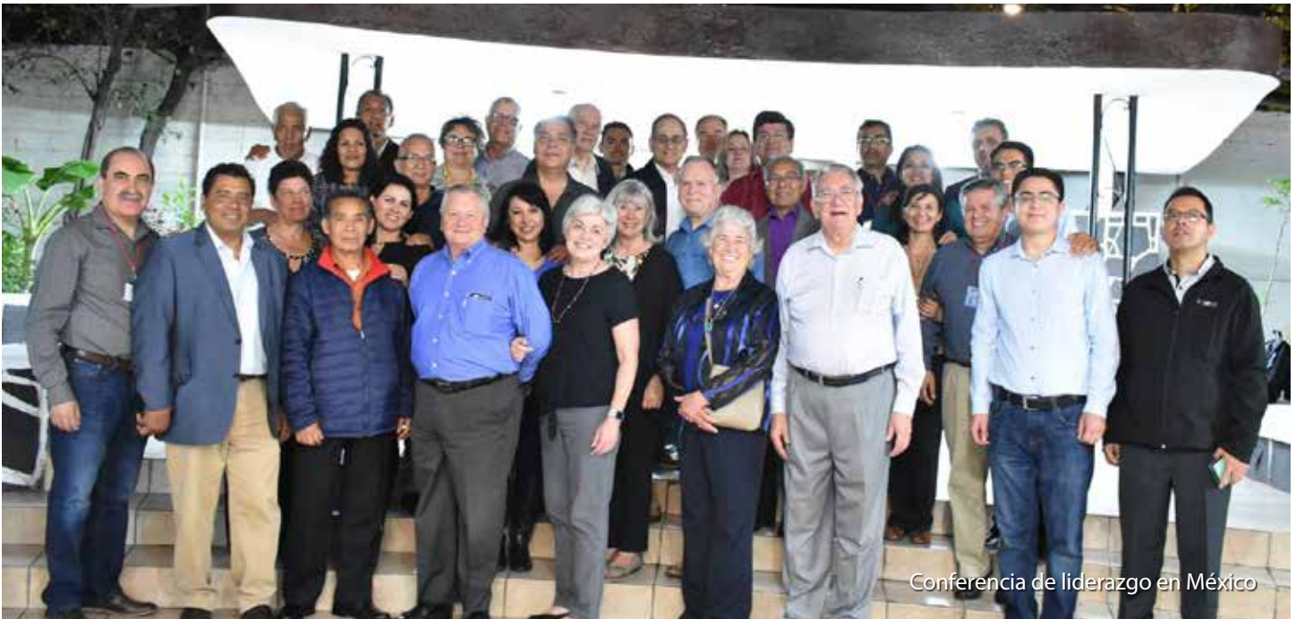
Conferencia de liderazgo en México