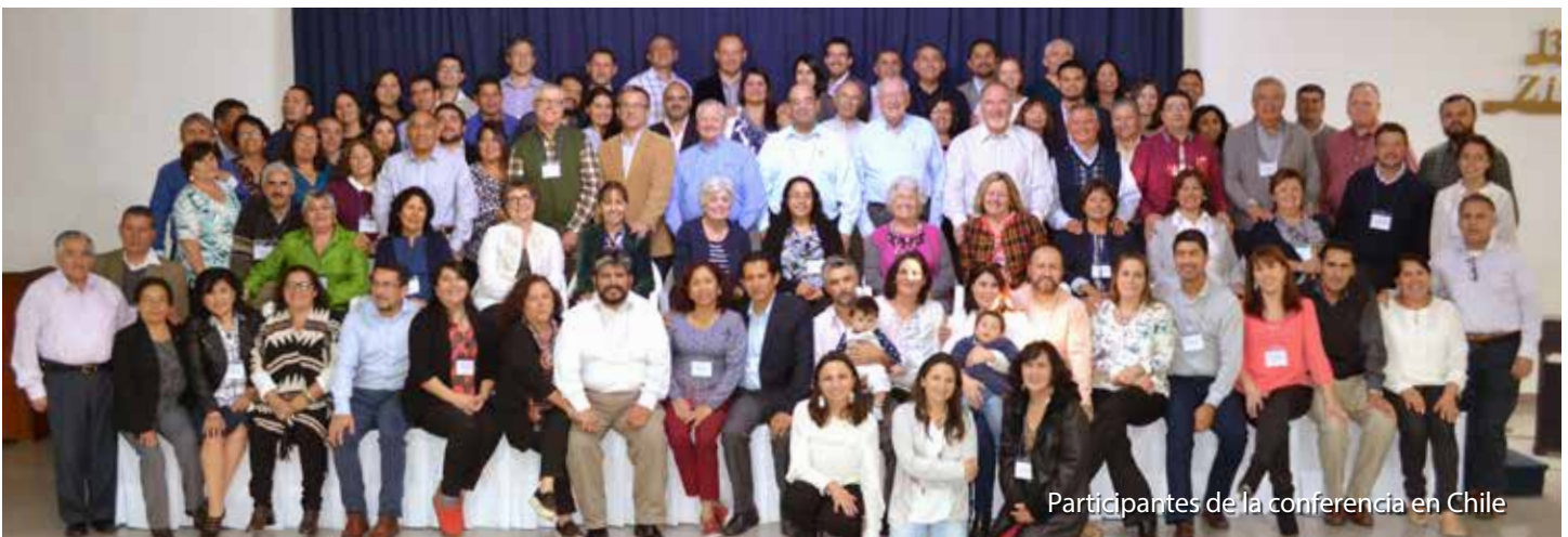
Participantes de la conferencia en Chile

Sí. Las conferencias de liderazgo en los tres lugares en Latinoamérica han sido un rotundo éxito. Pudimos sentir a Dios envuelto en todos los aspectos porque fueron para su honra y gloria y para preparar a personas que colaboren con Él en la supervivencia de su Iglesia y se cumpla con la profecía de Mateo 16:18: “y sobre esta roca edificaré mi iglesia; y las puertas del Hades no prevalecerán contra ella”. Gracias a Dios porque esta profecía sigue vigente hasta nuestros días. El milagro de la Iglesia está aún cumpliéndose. CA